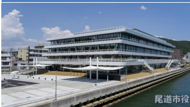
尾道市役所 本庁舎